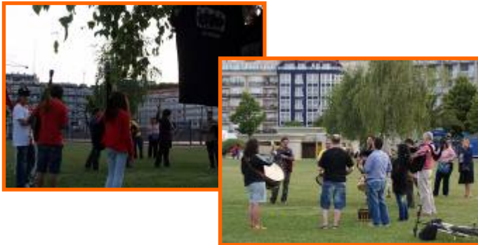
Ensaio na rúa

- Festivaliño : Concello de Sada. 11/08/2010.