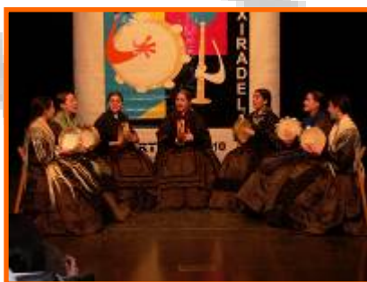
XI Concurso de Música tradicional Xiradela.

- XI Concurso de Música tradicional: Asociación xuvenil Xiradela. 18/04/2010.