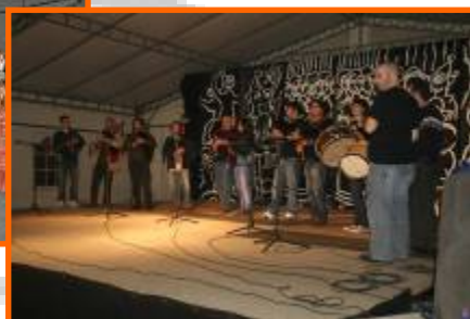
Sardiñada das festas