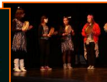
Foliada Forum folk