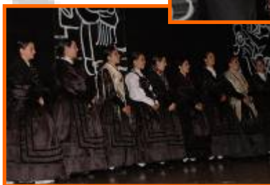
Festival "Ó noso ritmo"

- Ensaio na rúa : Concello de Sada. 09, 16, 23 e 30/07/2010.