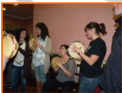
Festa de inverno