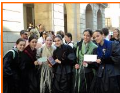
XXI Concurso de Música tradicional Xacarandaina.

Nos concursos, xa clásicos na actividade de Queiroa, este ano obtivemos un premio. Non se celebraron os de cuartetos de gaita da comarca.