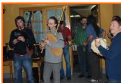
Festa de inverno